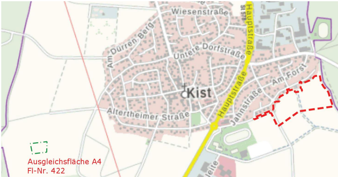
Übersichtsplan mit Ausgleichsfläche und Geltungsbereich Bebauungsplan (ohne Maßstab)

Der Entwurf des Bebauungsplans "Flussäcker 2 mit 3. Änderung des Bebauungsplans Flussäcker 1" mit Begründung und Umweltbericht in der Fassung vom 05.07.2021, geändert am 11.03.2024 liegen im Rathaus Kist, Am Rathaus 1, Zimmer 10, 97270 Kist, vom